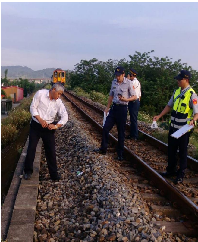
司機員向承辦員警說明目擊情形。