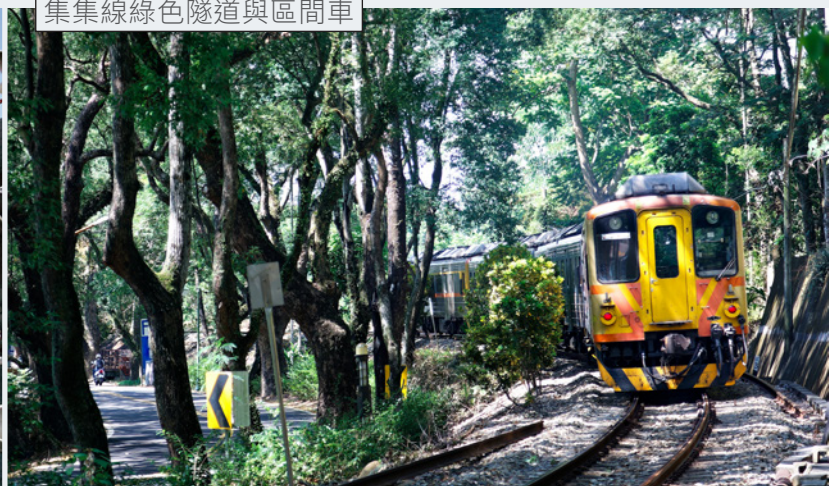
集集線綠色隧道與區間車