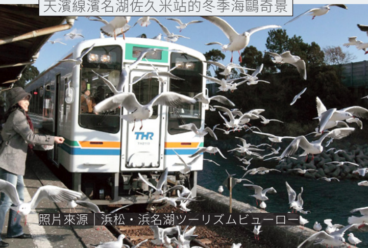
天濱線濱名湖佐久米站的冬季海鷗奇景

これからも、両路線の沿線に広がる美しい風景を相互に紹介することを通じて、友好関係を一層深化させるとともに、観光および文化交流の促進を図ってまいりたいと考えております。