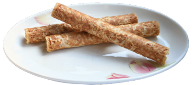
集集必買伴手禮 山蕉蛋捲

新，全面提升基礎設施。終於在2026年1月列車復駛至集集站，並規劃於7月全線通車！期能重新帶動沿線的觀光與活力。當您拜訪集集線，這裡不僅是一條旅遊的路線，更是一段災後重生、再次啟程的鐵道史。