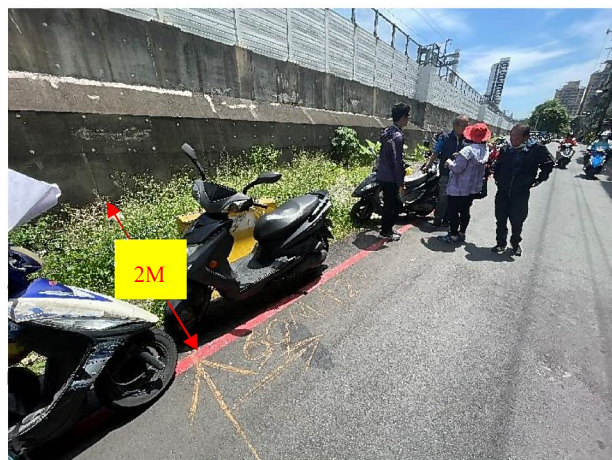
左側界線：約為大觀路二段 1 巷 10 號