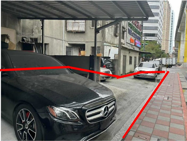
標的南側(臨馬路及人行道)