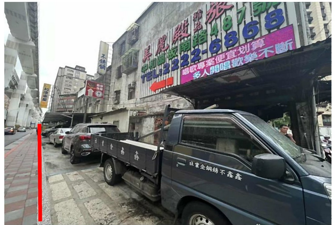
標的次南側(臨人行道)