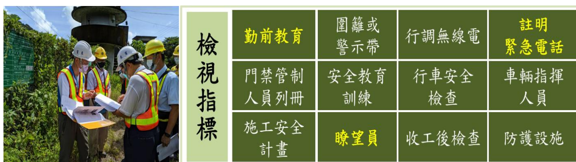
圖 1 臺鐵臨軌在建工程 12 項檢視項目

加強各工地安全管理，派專人保管工地大門鑰匙，管制人員進出，並於工地設置 CCTV 或電子圍籬，實施強化安全控管，如圖 1 所示。