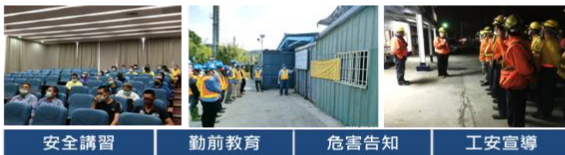
圖 4 臺鐵落實工地人員行車安全教育