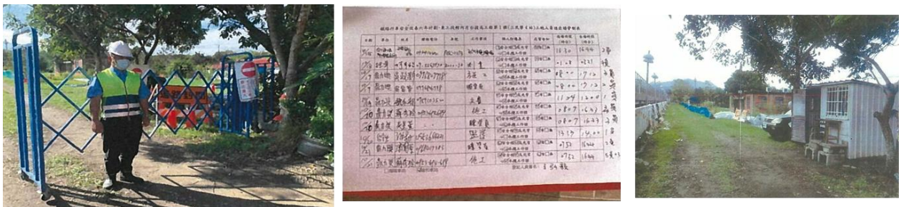
圖 3 臺鐵工地安全管理