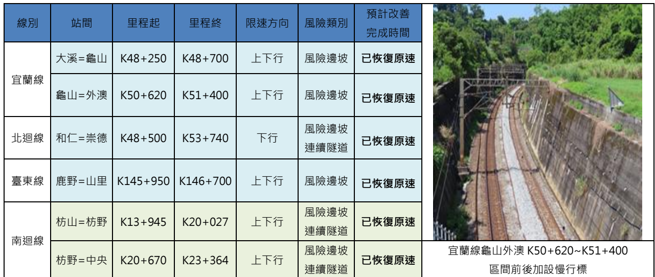
圖 7 東線列車降速運轉