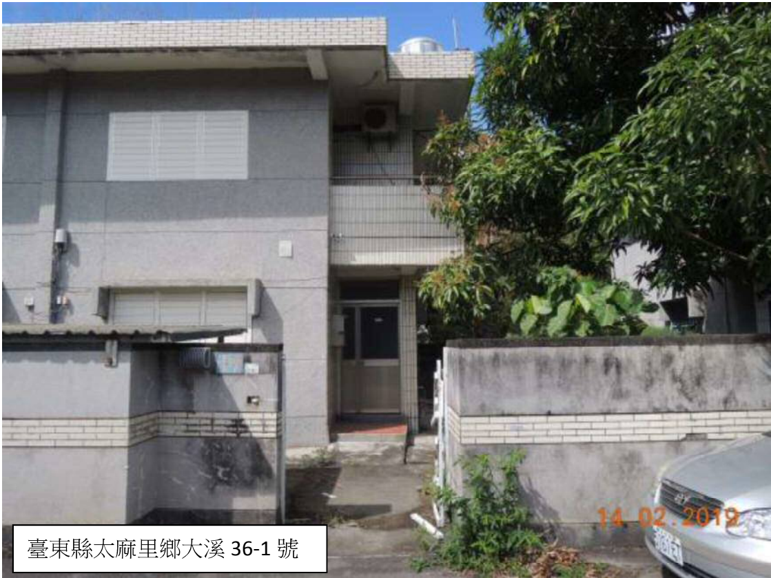
臺東縣太麻里鄉大溪 36-1 號