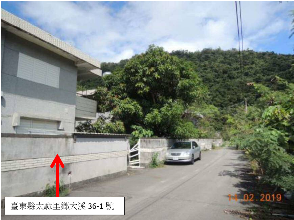
臺東縣太麻里鄉大溪 36-1 號