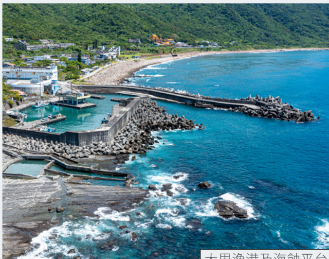
大里漁港及海蝕平台

石城車站為臺鐵極東車站，鄰近石城漁港。以舊鐵道改建而成的舊草嶺隧道自行車道，可連接新北市貢寮區的福隆車站，或環繞三貂角、福隆海濱公園等，欣賞東北角的無敵海景。石城車站旁設有觀海平台、咖啡館，可享受一段放鬆的午後時光。