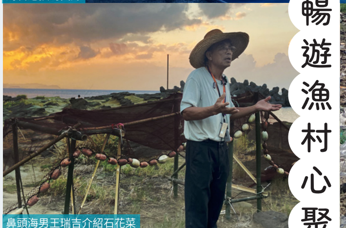
鼻頭海男王瑞吉介紹石花菜