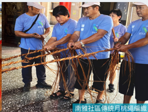
南雅社區傳統月桃繩編織