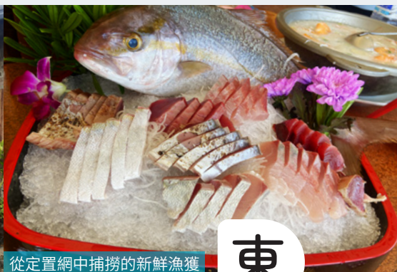
從定置網中捕撈的新鮮漁獲