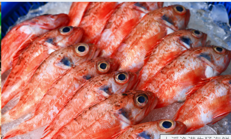
大溪漁港生猛海鮮