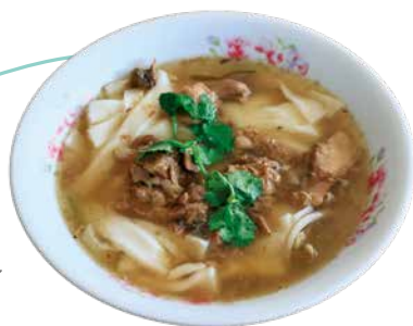
熬煮海味的 佳冬板條

來到佳冬，不妨嚐嚐街上平民美食——板條，鮮美湯頭由鮪魚熬成，肉燥則是以鮪魚混合豬肉，加上豬肝、蚵仔等海味配料，口味與其他地方客家板條截然不同，錯過可是會捶心肝！